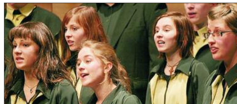
Die 18 Damen und 13 Herren des Kammerchors ersangen sich einen 1. Platz in der Kategorie „Gemischte Jugendchöre“

einer der traditionsreichsten ist. Gleichwohl hatte die Ausschreibung ihre Tücken. Neben einem Werk der Vokalpolyphonie, der CWG-Chor entschied sich für ein Monteverdi-Madrigal, einem Chorwerk aus dem eigenen Land und der Zeit nach 1920 (Andre Asriel: Affenballett) sowie einem Lieblingsstück des Chors („In The Mood“) war das Pflichtstück einer von zwei Chorsätzen des ungarischen Komponisten Zoltán Kodály (1882 bis 1967) – und zwar auf Ungarisch. Noch dazu einem Altungarisch, das von der modernen Sprache der Magyaren auch noch abweicht. Wie artikuliert man sowas nun korrekt? Einige Schüler marschierten zu dem Längs-Stand in der Inneren Plauenschen Straße, um sich von dem dort arbeitenden Ungarn ein paar Hinweise geben zu lassen. Offenbar mit Erfolg. „Der Palast der Künste, in dem der Wettbewerb stattfand, bietet fantastische Bedingungen. Die Holztafelung im Großen Saal lässt sich je nach Ver-