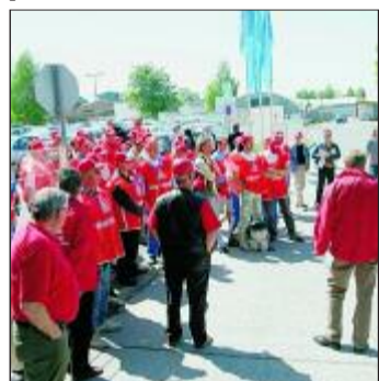
Beschäftigte von Johnson Controls hatten gestern vorübergehend die Arbeit niedergelegt.