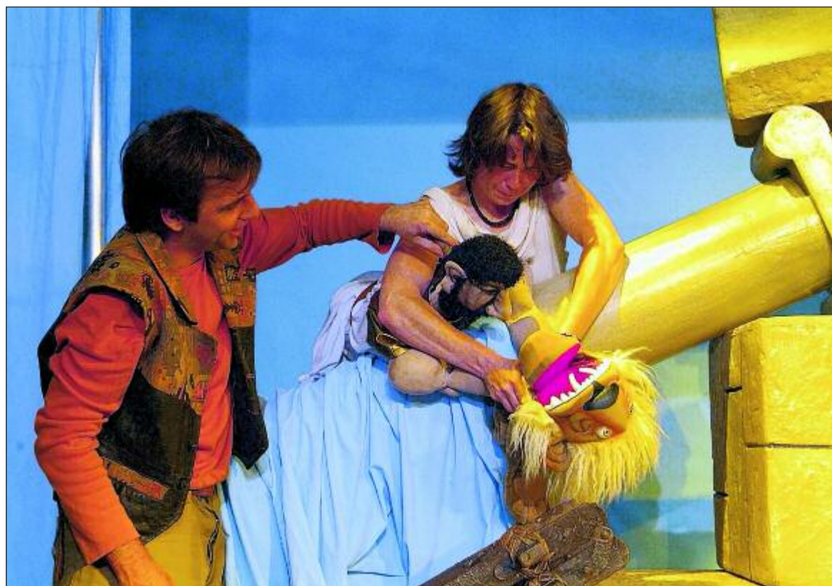
Den Nemeischen Löwen wird er wohl noch schaffen! Und wenn sein Fell ihn auch vor Pfeilen schützt, wenn Herakles' Hände zudrücken, macht selbst der stärkste Löwe schlapp.