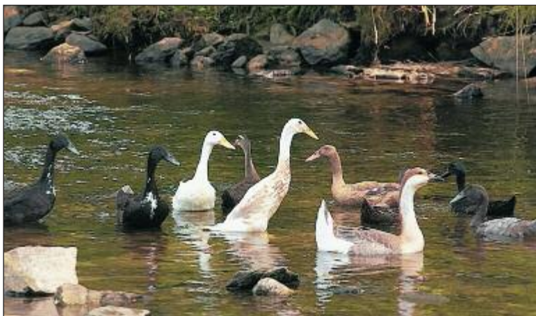
Friedlich fließt die Göltzsch durch Weißensand, Wasservögel baden im Fluss. Doch um die Edelkrebse wird heftig gestritten.

Fauna-Flora-Habitat-Richtlinie (FFH) Naturschutz-Verordnung der Europäischen Union, 1992 beschlossen. Ziel: Schutz von wild lebenden Arten und deren Lebensräume. Für die Umsetzung der FFH-Richtlinie suchen Naturschützer und Landschaftspfleger im Vogtlandkreis die Zusammenarbeit mit Eigentümern und Nutzern der entsprechenden Flächen.